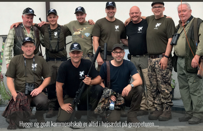
Hygge og godt kammeratskab er altid i højsædet på gruppeturen....