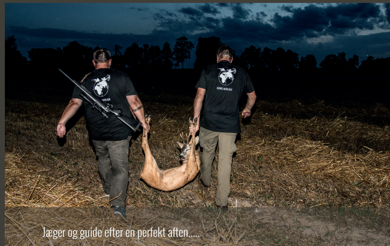
Jæger og guide efter en perfekt aften.....

GLOBUS JAGTREJSER | 6800 Varde www.globusjagtrejser.dk | info@globusjagtrejser.dk Tlf. 70 70 75 25 Medlem af rejsegarantifonden nr. 2602