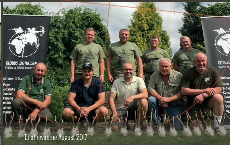
Et af revirene August 2017