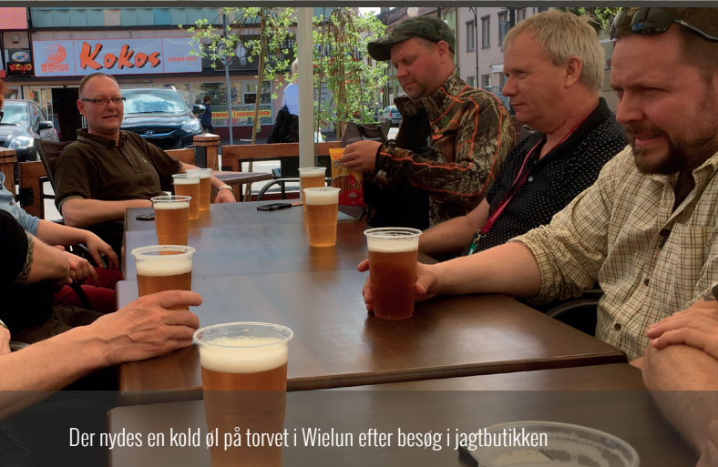
Der nydes en kold øl på torvet i Wielun efter besøg i jagtbutikken