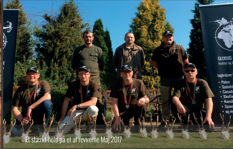
Et stærkt hold på et af revirene Maj 2017