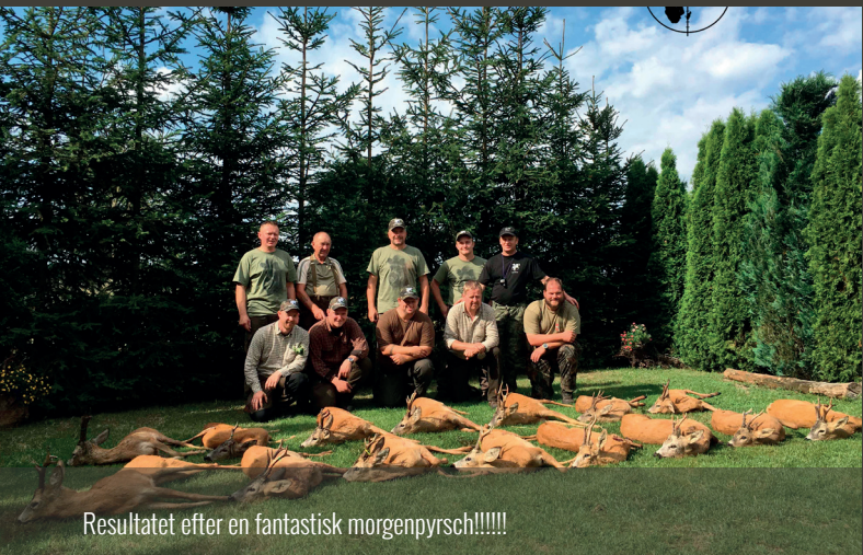
Resultatet efter en fantastisk morgenpyrsch!!!!!!